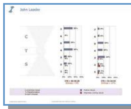
Leadership Values Distribution