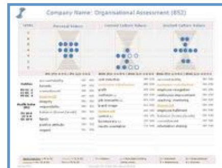
Comparatif des 7 Niveaux