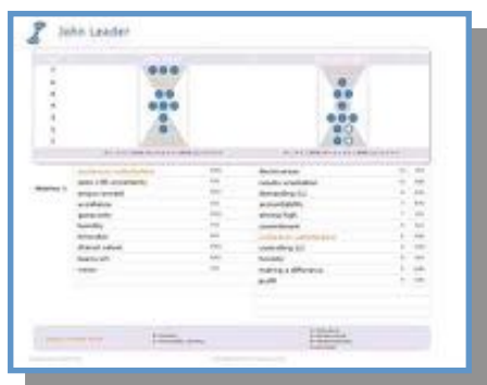
Leadership Values Assessment

Le "Leadership Values Assessment" vous sert à améliorer votre style de leadership par une prise de conscience à 360°.