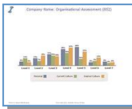
Diagnostic des valeurs positives