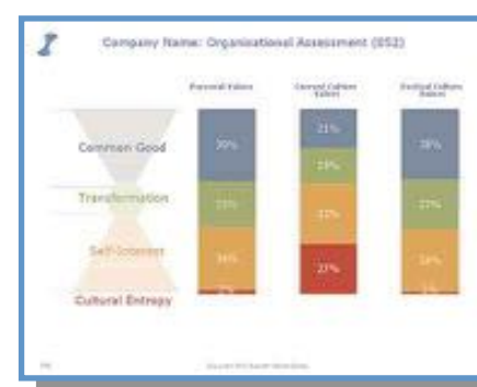
Analyse en 3 niveaux + entropie